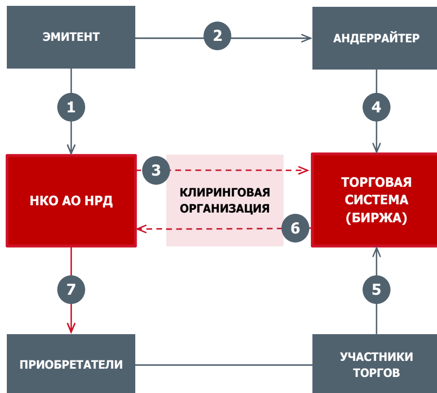
СХЕМА РАЗМЕЩЕНИЯ ОБЛИГАЦИЙ ЧЕРЕЗ ТОРГОВУЮ СИСТЕМУ (БИРЖУ)