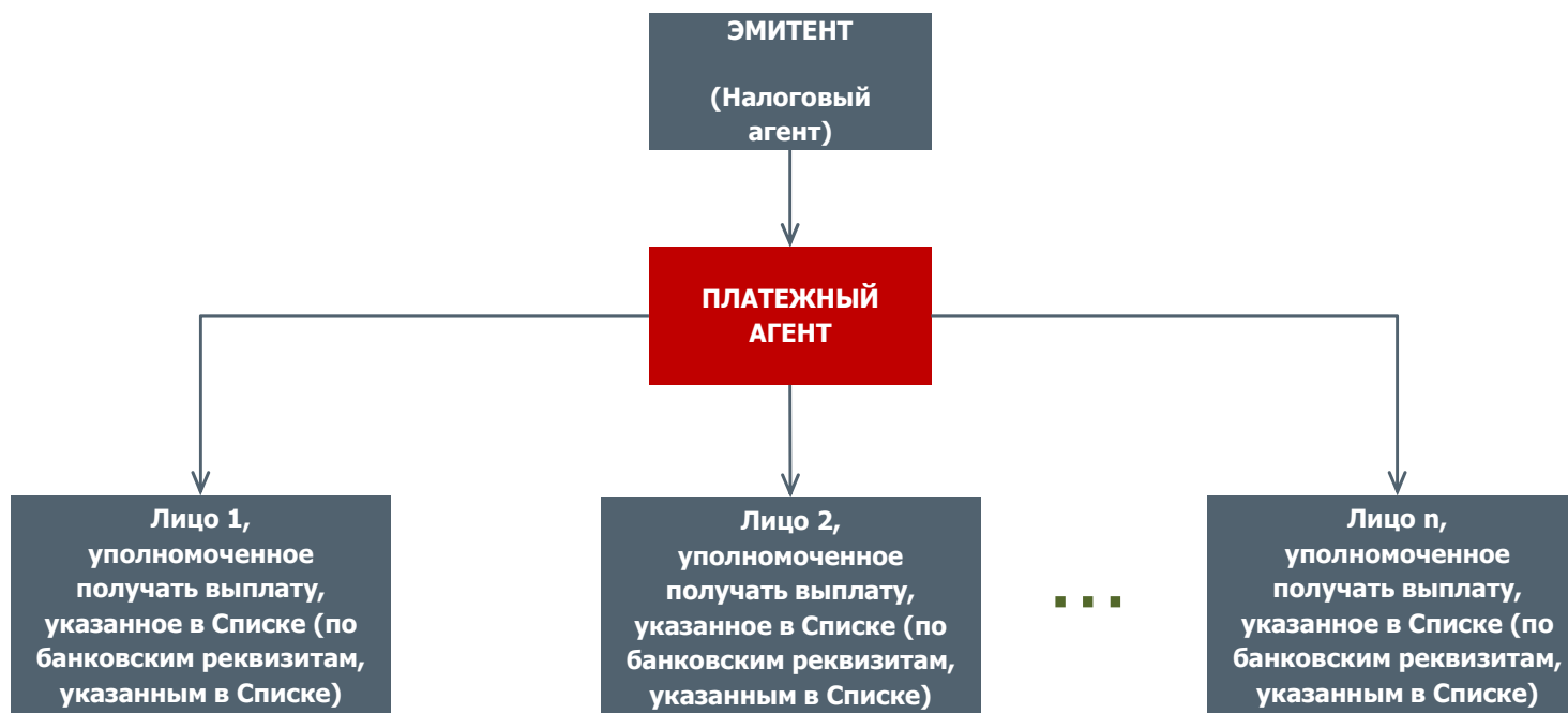
СХЕМА ВЫПЛАТЫ ДОХОДОВ ПО ОБЛИГАЦИЯМ ВЫПЛАТЫ ПО СПИСКАМ*

*для облигаций, государственная регистрация которых или присвоение идентификационного номера которым осуществлены до 1 января 2012 года .